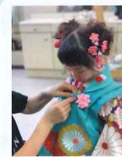
担当: 諏訪会館美容部

>アドバイス< 諏訪会館1階の 美容室でお支度開始。 当日は移動が無くて 楽だよ!